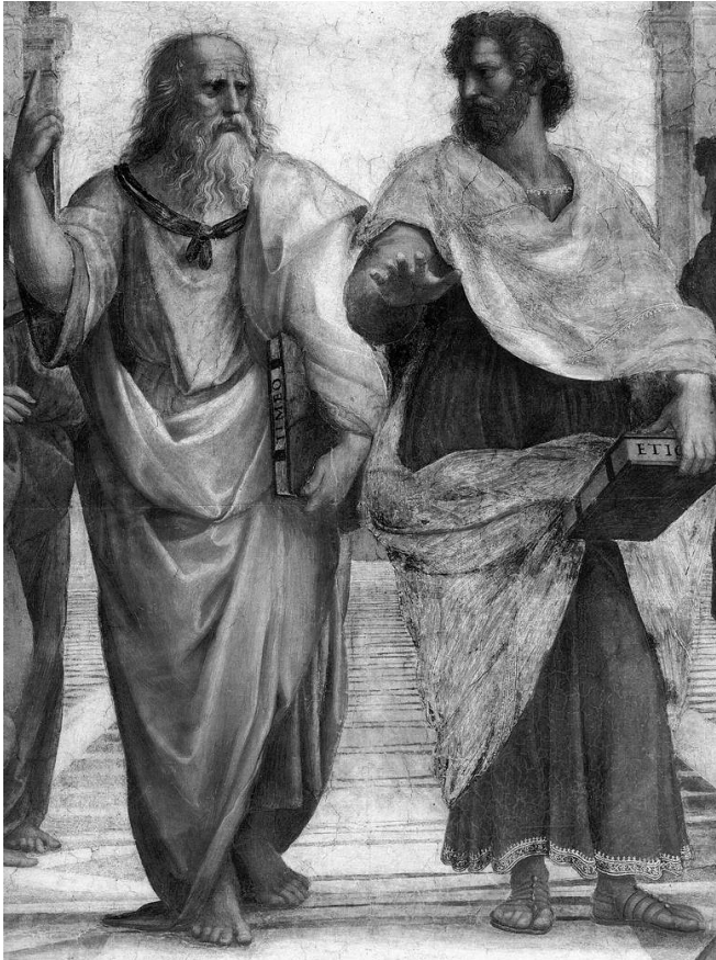
Plato en Aristoteles. Fragment van Scuola di Atene , fresco van de Italiaanse renaissancekunstschilder Rafaël.